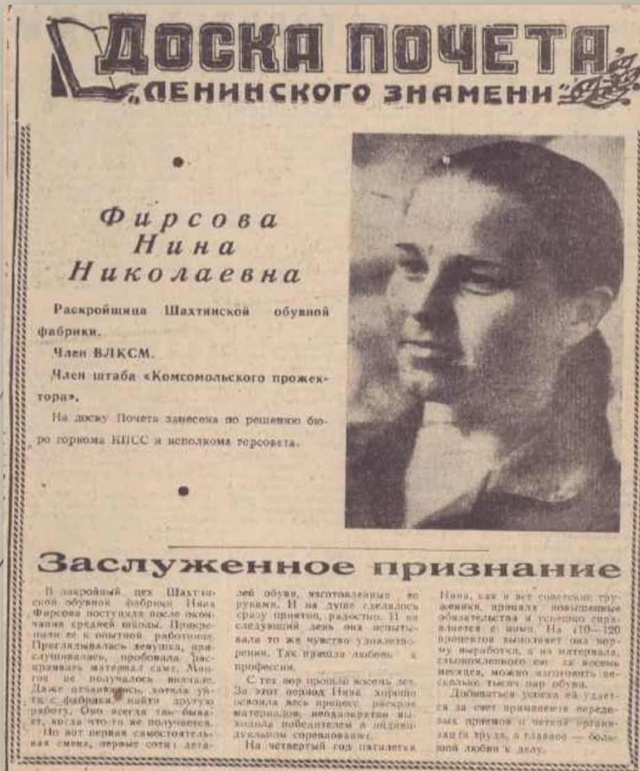
Ф. Р-1105, Оп. 2, Д. 1, Л. 27.