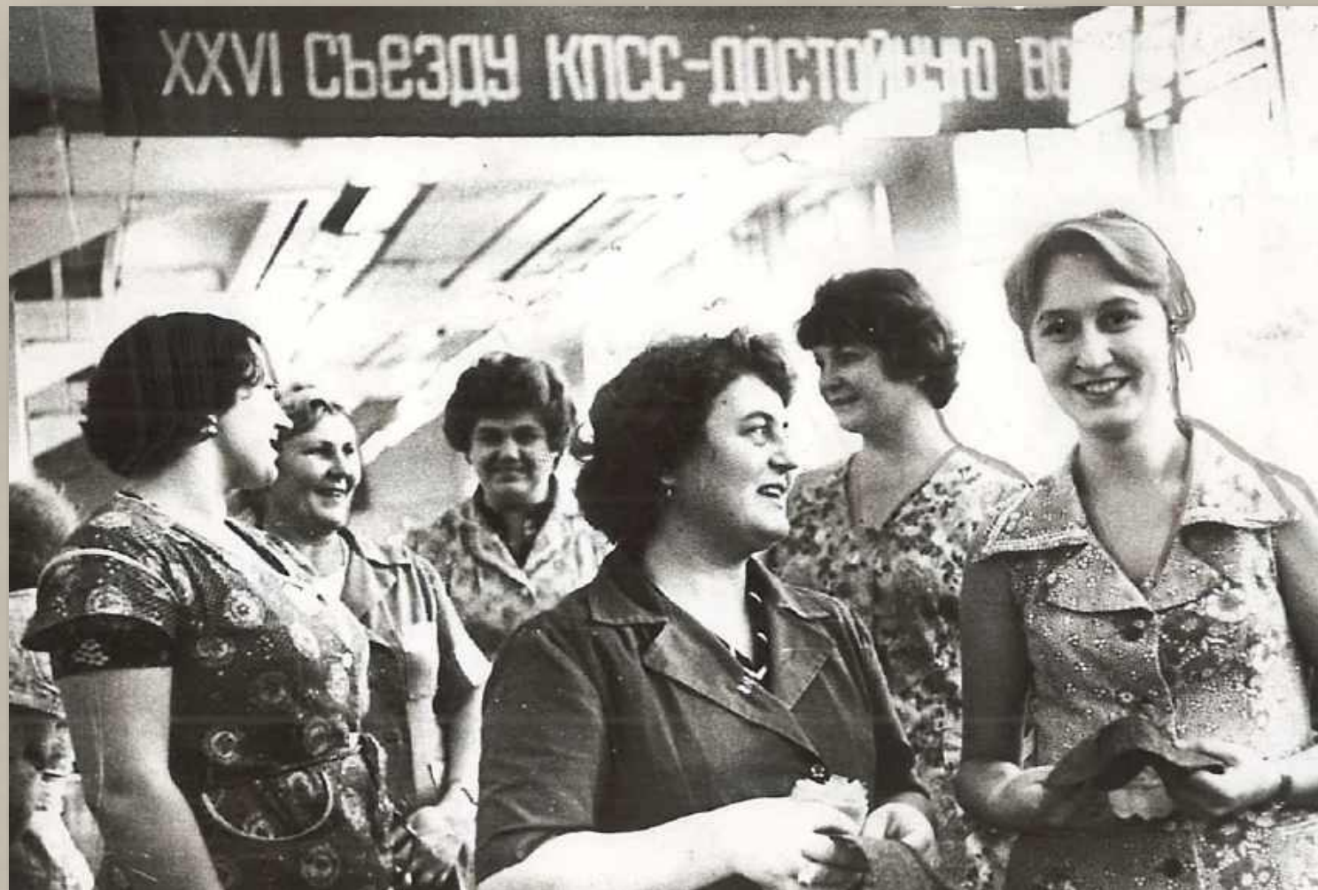
Фотодокументы группы ПА, Опись-1, Дело 111.