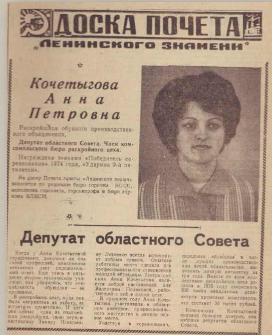
Ф. Р-1105, Оп. 2, Д. 3, Л. 16.