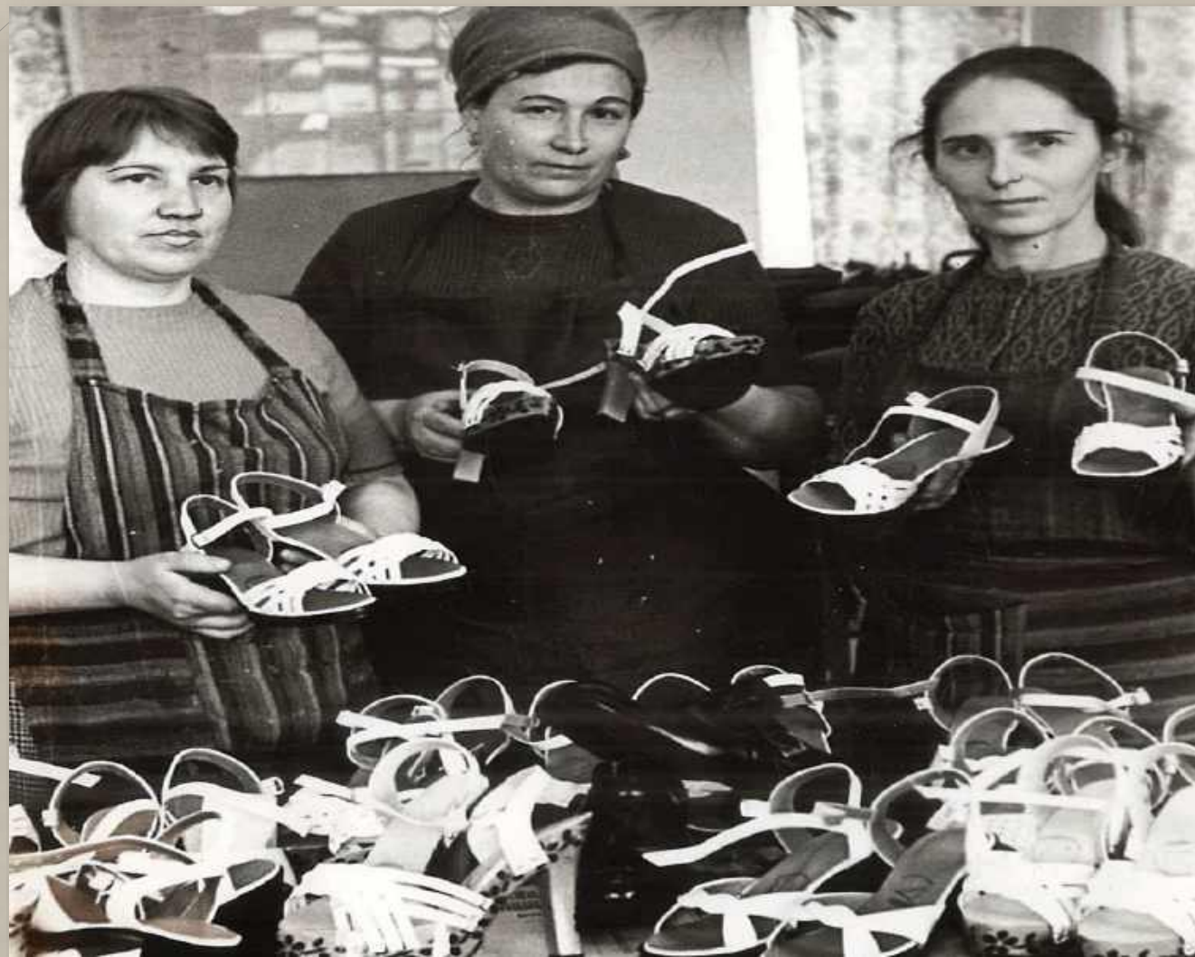
Фотодокументы группы ПА, Оп.-1, Д. 55.