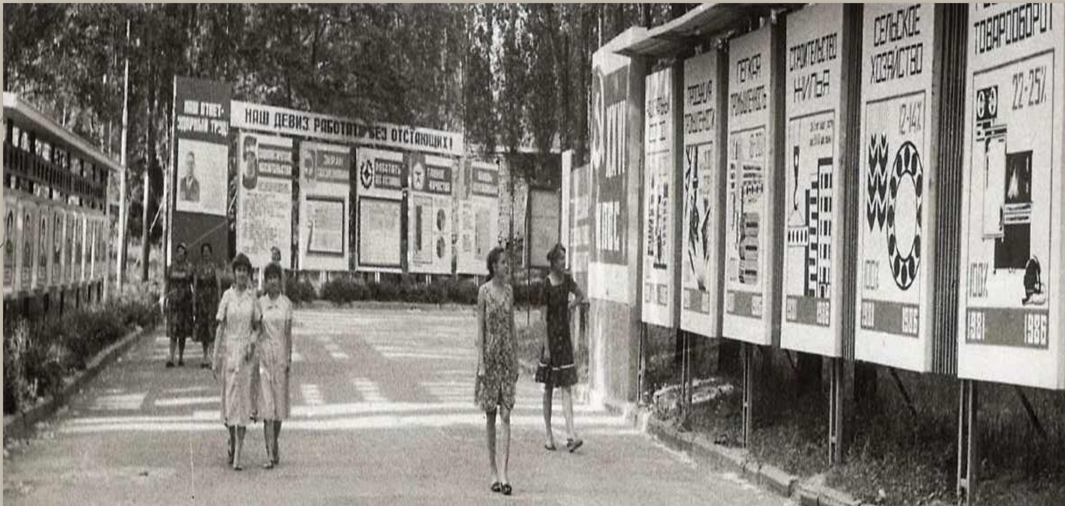
Фотодокументы группы ПА, Описание-1, Дело 120.