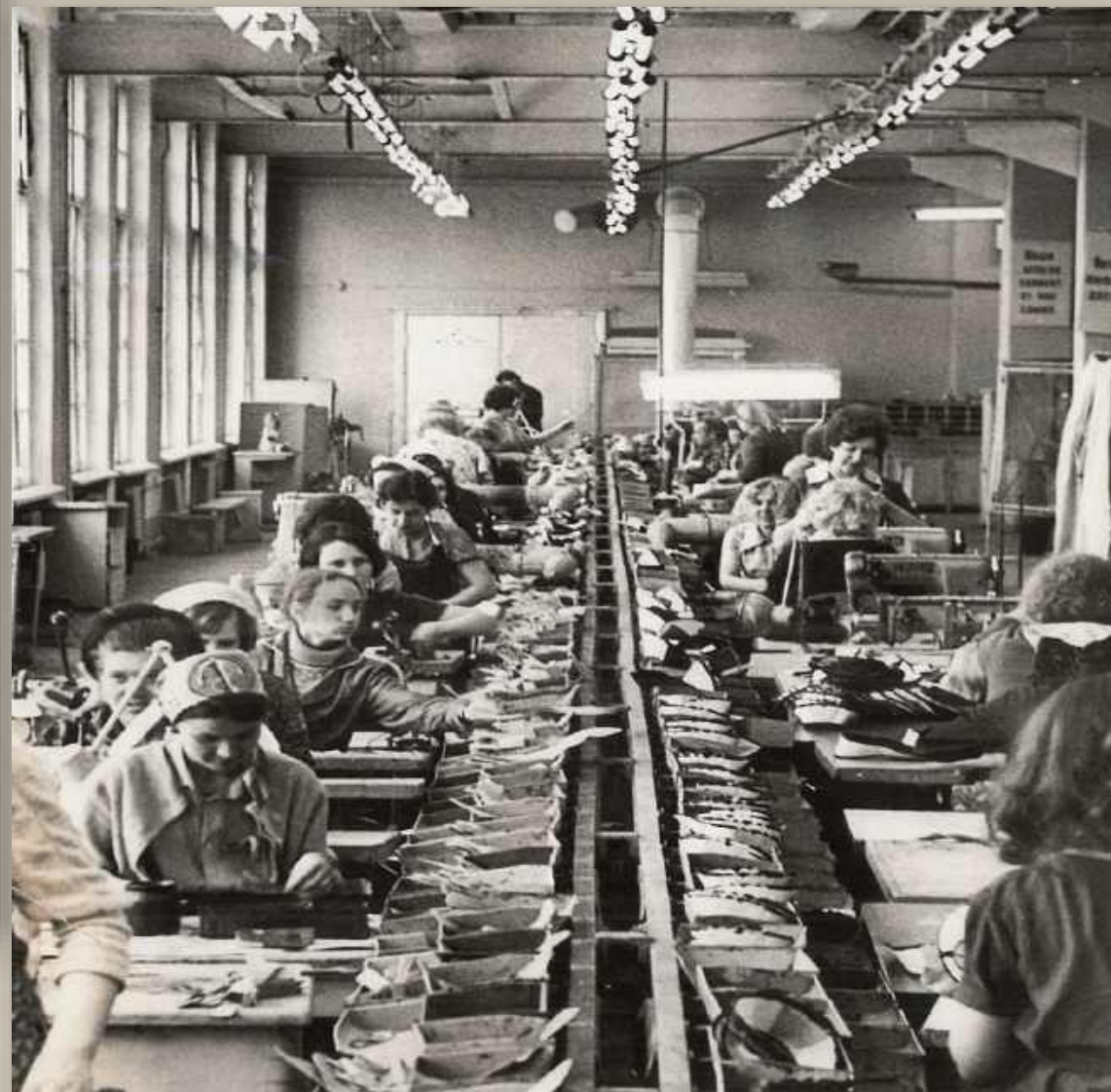
Фотодокументы группы ПА, Оп.-1, Д. 88.