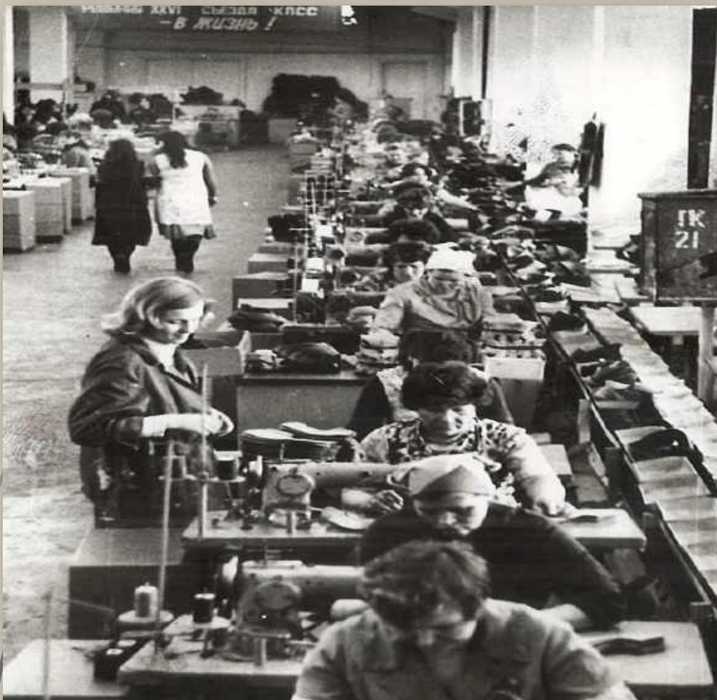
Фотодокументы группы ПА, Оп.-1, Д. 77.