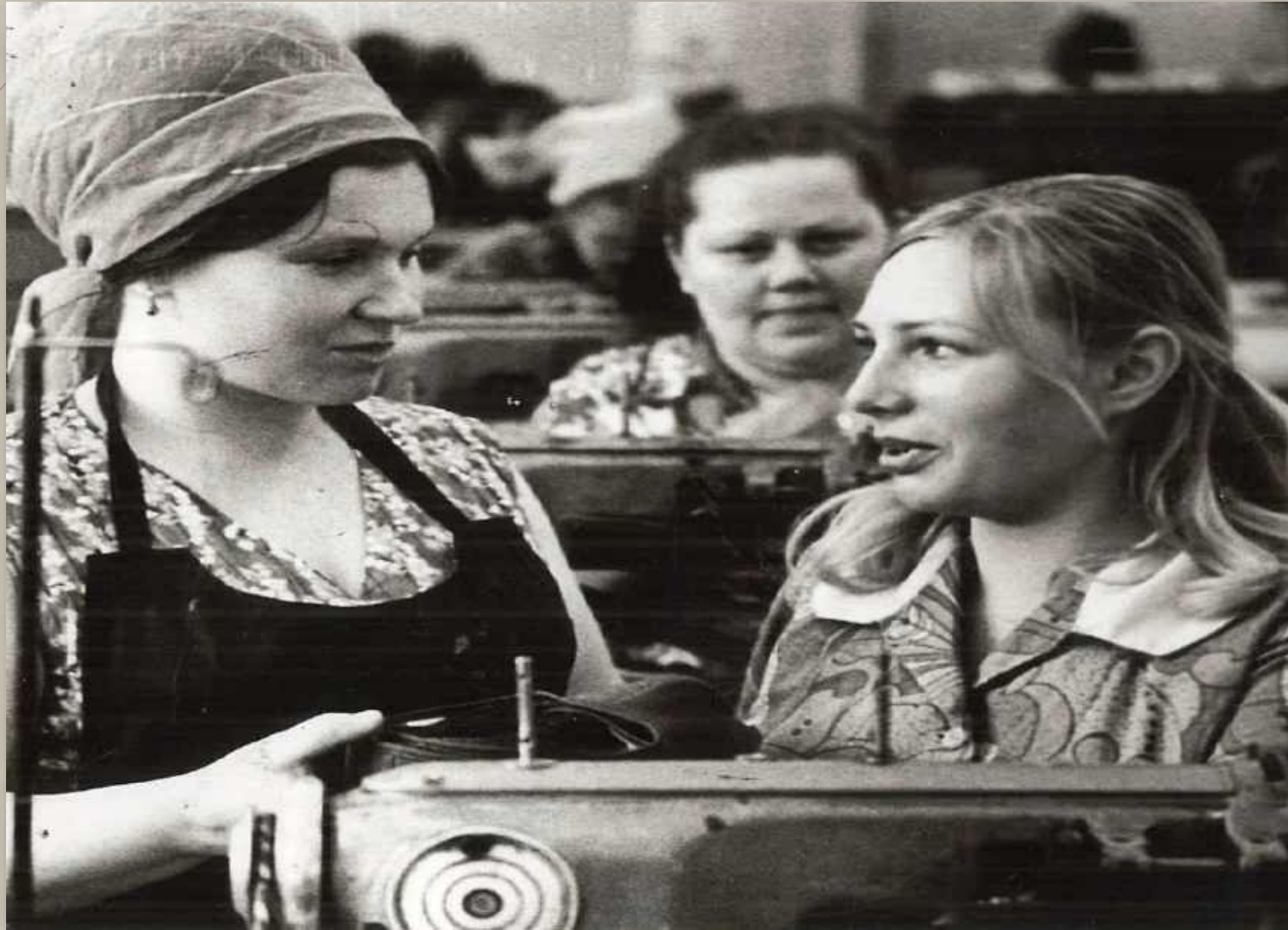
Фотодокументы группы ПА, Оп.-1, Д. 63.